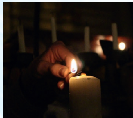
Å tenne lys er viktig. I juletiden. I kirken. Og på speidernes lysmesse.