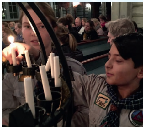
Speiderne deltar i feiringen av Gudstjenesten. Her tennes lys i globen.